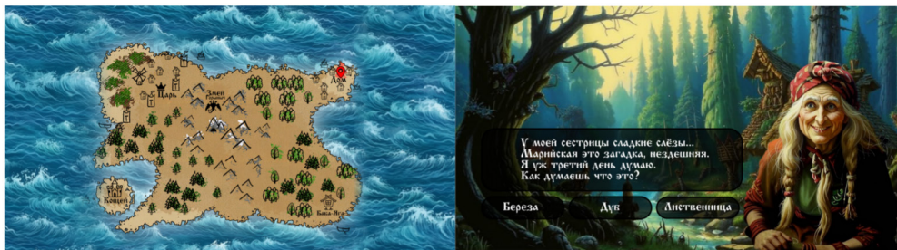
Рис. 5. Игры по сюжетам

Пример игры: «Путешествие с Алешей Поповичем» переносит игроков в мир русских былин. Путешествуя по интерактивной карте (рис. 5, а), участники решают загадки о традициях разных народов (рис. 5, б), расшифровывают древние символы и выполняют логические задания. Награды: баллы для рейтинга и прогресс в сюжете.