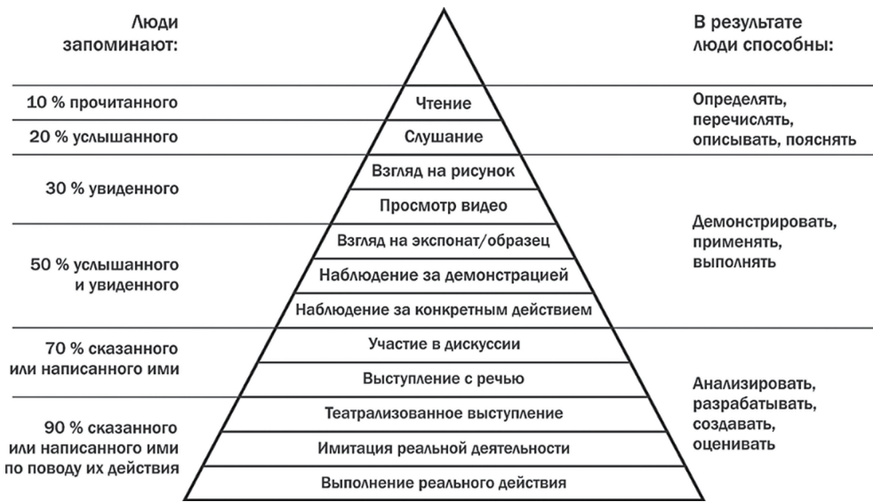
Рис. 1. Конус обучения

Источники: Ефимова Е. Г. Инновации в образовательном пространстве // Вестник магистратуры. 2015. №11–2 (50). https://www.magisterjournal.ru/docs/VM50_2.pdf