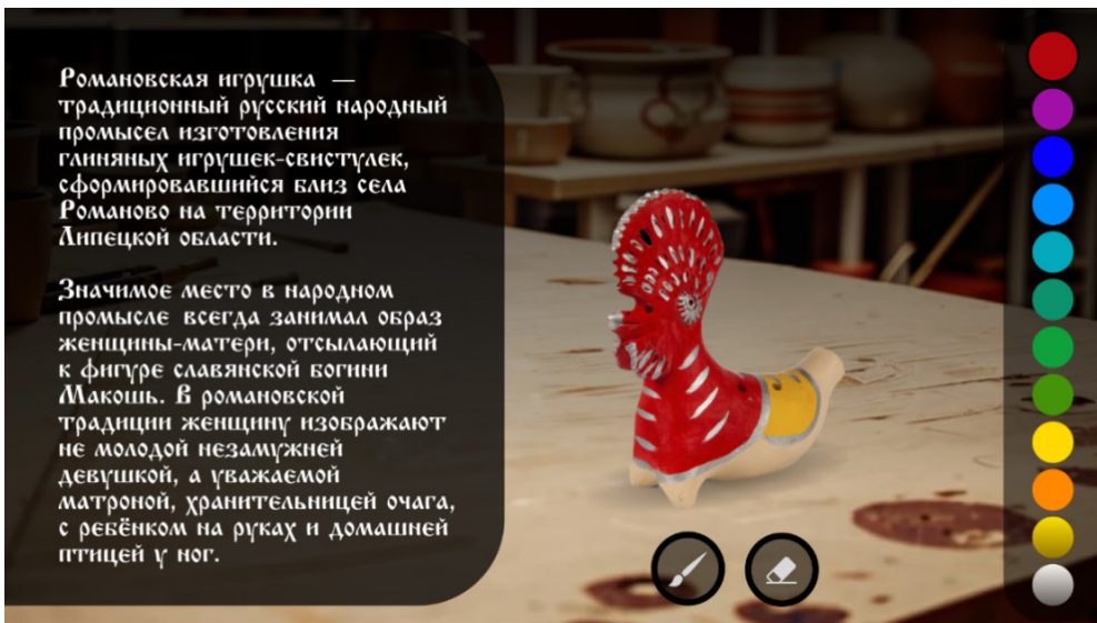
Рис. 6. Игры по созданию народных игрушек. Романовская игрушка.

Пример: в «Мастерской романовской игрушки» игроки проходят все этапы традиционного ремесла – от виртуальной лепки до выбора аутентичных узоров и цветов. Каждый этап сопровождается мини-викторинами об истории промысла. Готовые работы попадают в виртуальную галерею, открывая доступ к новым видам игрушек.