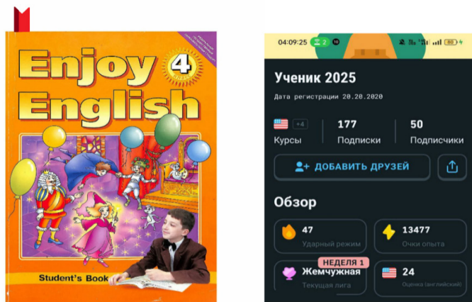
Рис. 3. Накопление очков и отслеживание прогресса

Накопление очков и отслеживание прогресса. Этот компонент помогает удерживать внимание обучающегося. В учебнике прогресс отслеживается лишь косвенно – по количеству пройденных страниц или закладкам (рис. 3, а), что слабо стимулирует к дальнейшему изучению. В Duolingo очки суммируются и отображаются в реальном времени (рис. 3, б), создавая ощущение постоянного движения вперед. Ученик видит рост своих показателей, и это стимулирует его продолжать обучение. Наглядность прогресса поддерживает концентрацию и усиливает мотивацию.