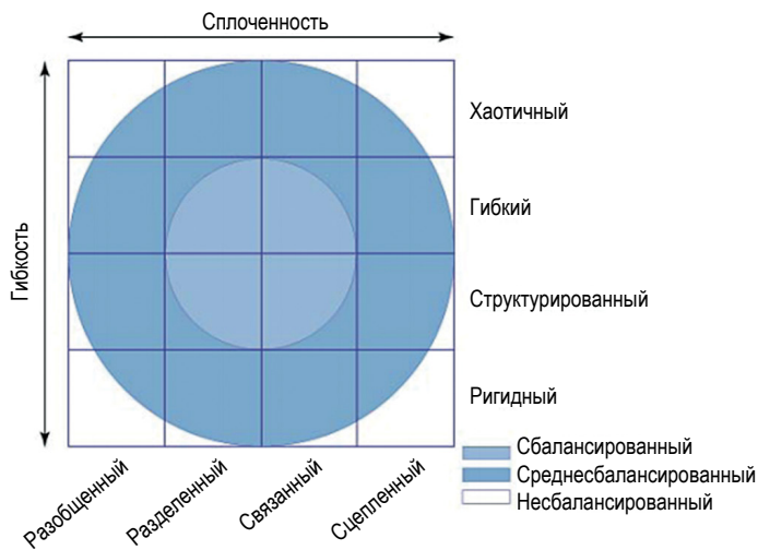
Рис. 1. Циркулярная модель Д. Олсона

Согласно модели Д. Олсона, устойчивость семейной системы определяется степенью ее гибкости и сплоченности 13 . В сбалансированных семьях партнеры могут перераспределять роли в зависимости от ситуации, что позволяет эффективнее справляться со стрессом и жизненными трудностями. Напротив, несбалансированные системы характеризуются либо ригидностью (жесткая фиксация ролей), либо хаотичностью (их нестабильность), что затрудняет адаптацию семьи к внешним изменениям.