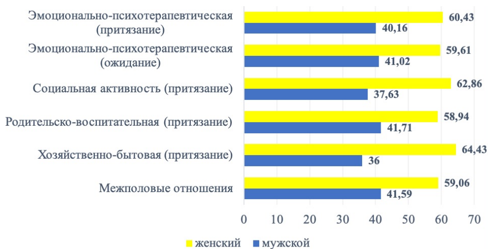
Рис. 3. Диаграмма ролевых ожиданий по полу.

На рис. 3 отображены результаты сравнительного анализа, демонстрирующие более высокие значения ролевых ожиданий и притязаний у женщин. Это может быть связано с тем, что женщины воспринимают свою роль в семье как более многогранную и включающую в себя больше функций.