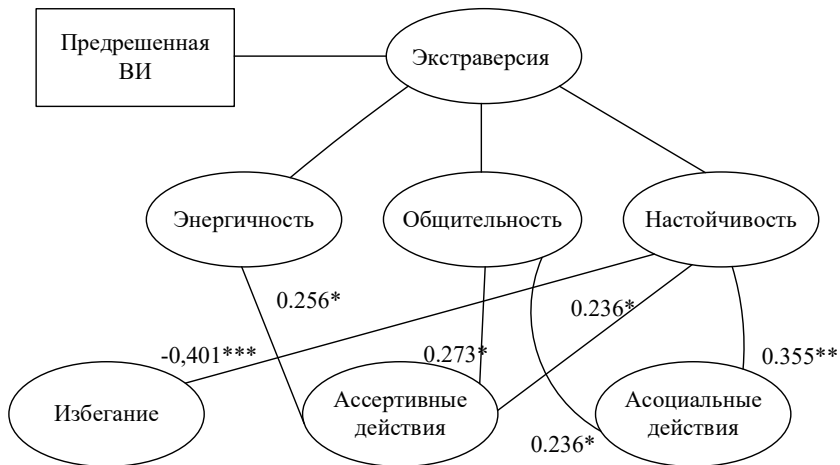
Рис. 1. Схема значимых связей между показателями статуса виртуальной идентичности, экстраверсией, ее аспектами и используемыми защитно-совладающими стратегиями